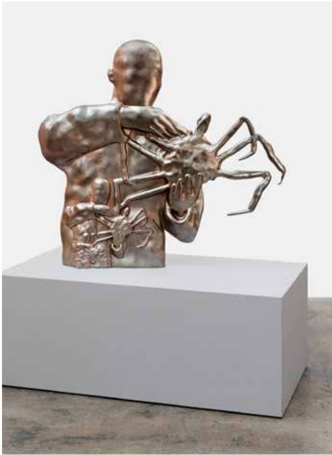
Оливер Ларик. Човек с рак, 2019, галванизирана мед, 95 x 100 см, 5 + 2 AP. Със съгласието на художника и галерия Тая Лейтън, Берлин и Лос Анджелис Oliver Laric. Person with crab, 2019, electroformed copper 95 x 100 cm, 5 + 2 AP. Courtesy of the artist and Tanya Leighton, Berlin and Los Angeles

The exhibition features works on concrete showing black and white exposures, which are sometimes hand-colored in addition. “I am an Other” shows the artist mirroring herself in the midst of an abandoned and open arcade building, creating a utopian constellation of self-introspection. Another image shows an empty swimming pool in Pelegrin, Croatia whose colored effects evoke a future scenario that is heightened through the protagonist’s attire. I is the emptiness in many of Graschopf’s photographic installations, which represent haunted and uncanny territories where utopian and dystopian elements intertwine. Graschopf’s use of concrete and her focus on architecture leads to a correlation between the materiality of the photographic surface and the buildings depicted.