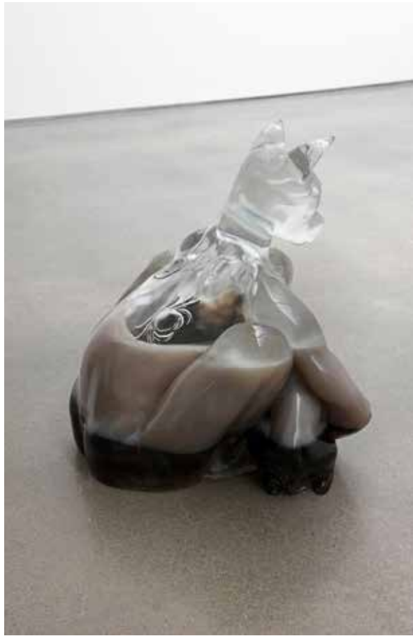
Оливер Ларик. Човек-куче, 2018, полиуретан, 53 x 52 x 58 см. Oliver Laric. Dog man, 2018, polyurethane, 53 x 52 x 58 cm.