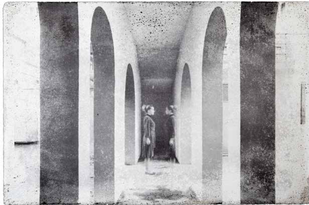
Биргит Грашоф. Аз съм друга / Серия с експонации, 2019, фотография върху бетон, 40 x 60 см Birgit Graschopf. I Is Another / Exposed Series, 2019, photography on concrete, 40 x 60 cm

Art has always been at the forefront of media technologies and tries to analyze how technical developments mingle with physical realities and how the subject is situated within this realm of representation. For more than twenty years, the Internet has been the testing ground for new methods of interfering into reality and of virtually connecting people. The construction of image politics has equally been at stake as the representation of reality no longer follows the concept of truth or mere documentation. Moreover, artificial intelligence has entered many aspects of life and is taken up by artists who develop future perspectives to be probed in the here and now. Over the years, artificial reality and artificial intelligence have led to a new process of image making bereft of a physical human subject. Yet it is humans who influence these virtual mechanisms, sometimes leaving it up to machines to deliver the end product. 3D printing is one of the results of this evolution, which allows the computer to generate whole new worlds out of a binary source code. The final question is when will these entities programmed by humans take over humanity itself? The artists in the exhibition try to work with such future conditions that might be looming or already be implemented in the present. They try to fathom ways in which a not-so-distant future interferes with the present and how different image politics help foster utopian scenarios. >>