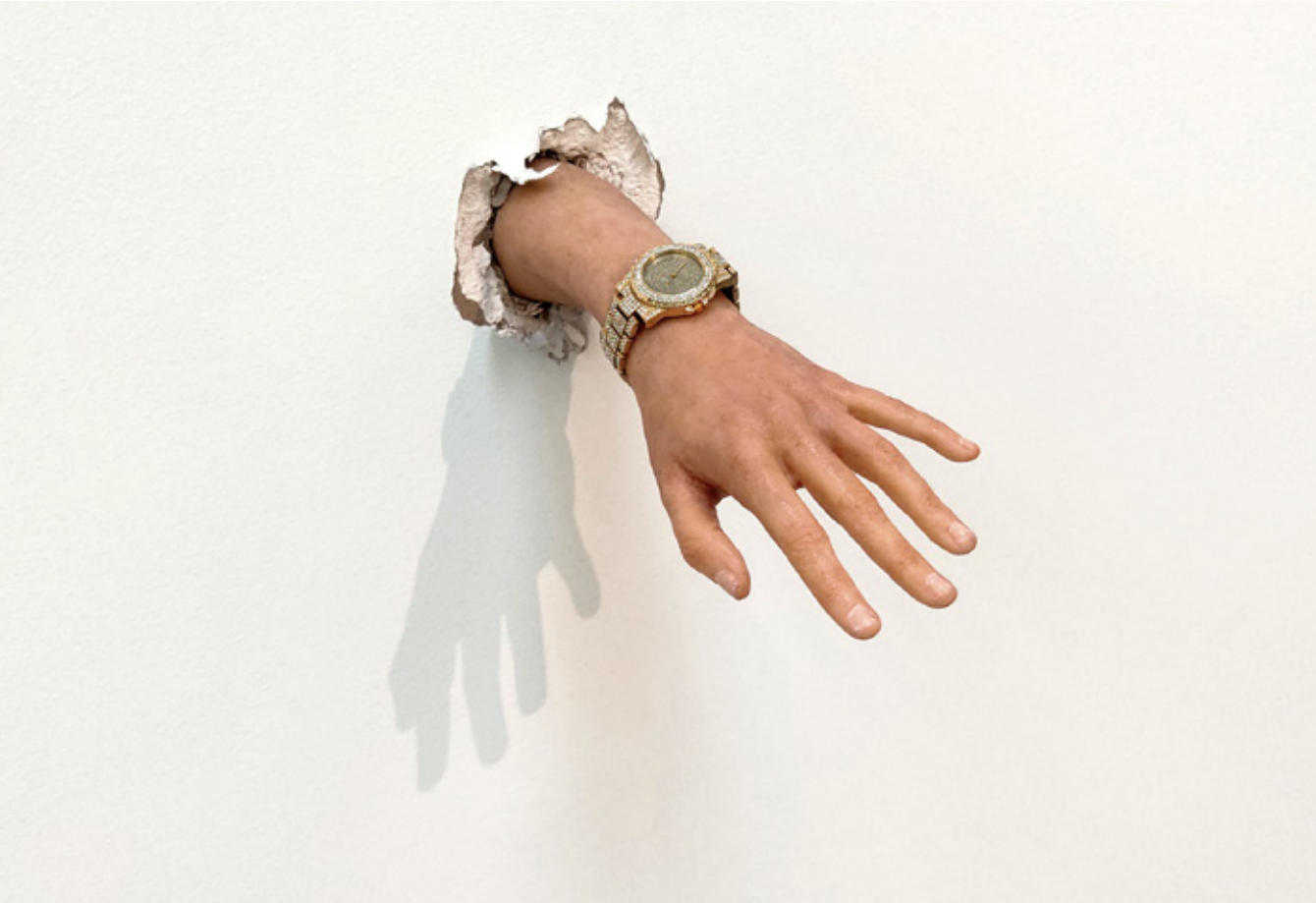
За човека, който се смее над нас, 2021, силиконова ръка в реален размер, часовник For The Man Who Laughs Above Us, 2021, real size silicon hand, watch

With the work Violet From Which is Dripping Blood Leda Ekimova tries to remove the meaning of the symbol in order to enter the very technology of meaning, which acts only through spatial sensitivity. The two opposite arrangements of the installation - chaotic and linear, lead to two opposite states of perception. Each of the two installations consists of a set of 7 identical images on a progressive scale and so the drawings create an optical tangibility of space, formalizing the image. This renders meaningless the symbolic load of the object, which is exclusively in the colors of the gloomy and sublime feelings of melancholy, drama and tragedy. The phrase Violet From Which is Dripping Blood , saturated with color symbolism, is the only carrier of the color, as the drawings are monochrome in graphite color.