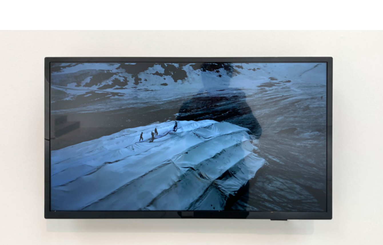
Синиша Илич и Бојан Джорджев Orientation in 100 revolutions, 2017-, картина, пърформанс, инсталация, художествено проучване, видео документация Siniša Ilić and Bojan Djordjev Orientation in 100 revolutions, 2017-, picture, performance, installation, artistic research, video documentation

Пърформансът е осъществен и заснет по време на пандемията, когато достъпът до галериите, музеите и изкуството като цяло е ограничен почти напълно. 100 квадратни метра изображение, носещо референции към различни източници на модерното изкуство, е положено върху ледника Каунертал в Тирол, Австрия. The performance took place and was filmed during the pandemic, when the access to galleries, museums and art in general was almost completely restricted. A 100-square-meter image bearing references to various sources of modern art is placed on the Kaunertal Glacier in Tyrol, Austria.