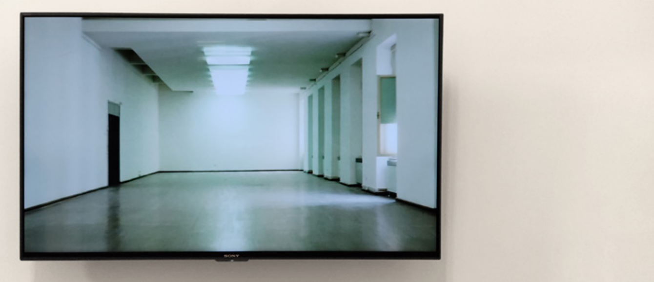
Waste, 2018, видео 4'7"Waste, 2018, video 4'7"

Пърформансът е осъществен и заснет по време на пандемията, когато достъпът до галериите, музеите и изкуството като цяло е ограничен почти напълно. 100 квадратни метра изображение, носещо референции към различни източници на модерното изкуство, е положено върху ледника Каунертал в Тирол, Австрия. The performance took place and was filmed during the pandemic, when the access to galleries, museums and art in general was almost completely restricted. A 100-square-meter image bearing references to various sources of modern art is placed on the Kaunertal Glacier in Tyrol, Austria.