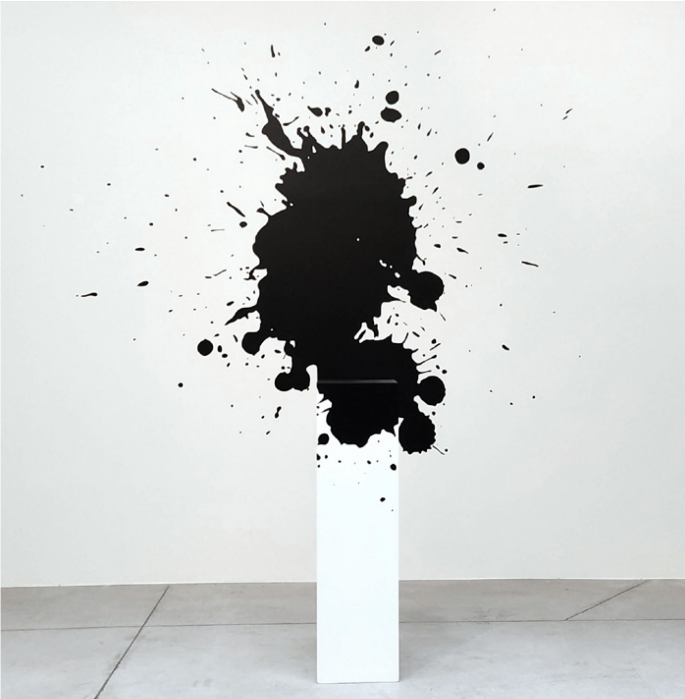
Реконструкция, 2008-2021, самозалепващо се фолио, вариращи размери / Reconstruction, 2008-2021, adhesive vinyl, variable dimension

In this work the artist is presenting white cube, gallery ambient. It is a kind of non-place, a neutral space that usually serve as background for emphasizing art objects. This aseptic interior is transformed into a potential urban landscape that again with a play of scale is transformed with two jumping figures. Tthe simple gesture of holding hands is the structure that holds all this elements together. The idea of touch and proximity is confronted with infinity of the material and virtual spaces.