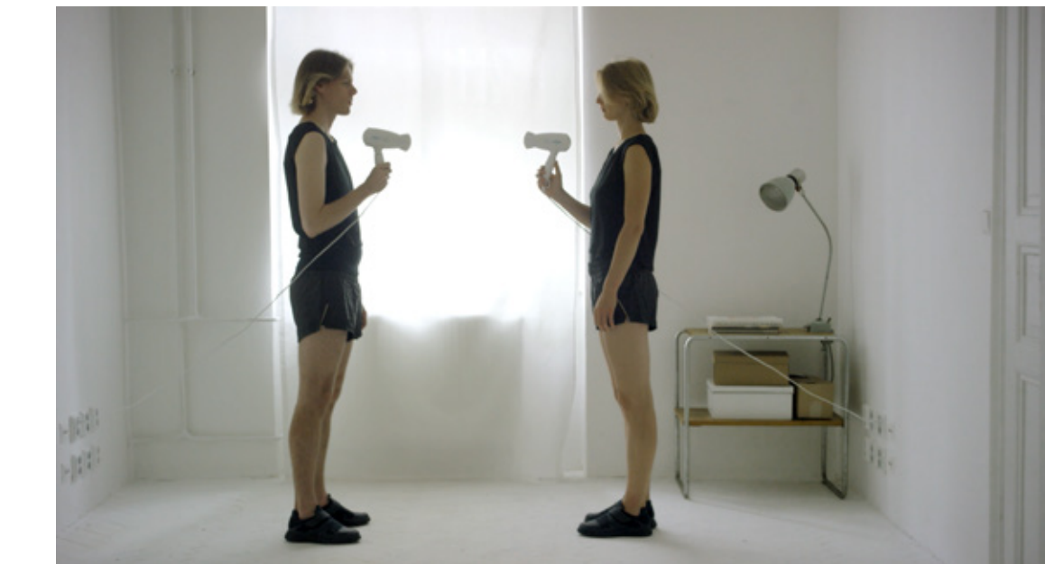
#Factor of 6, 2019, видео 12' 47" / #Factor of 6, 2019, video 12' 47"