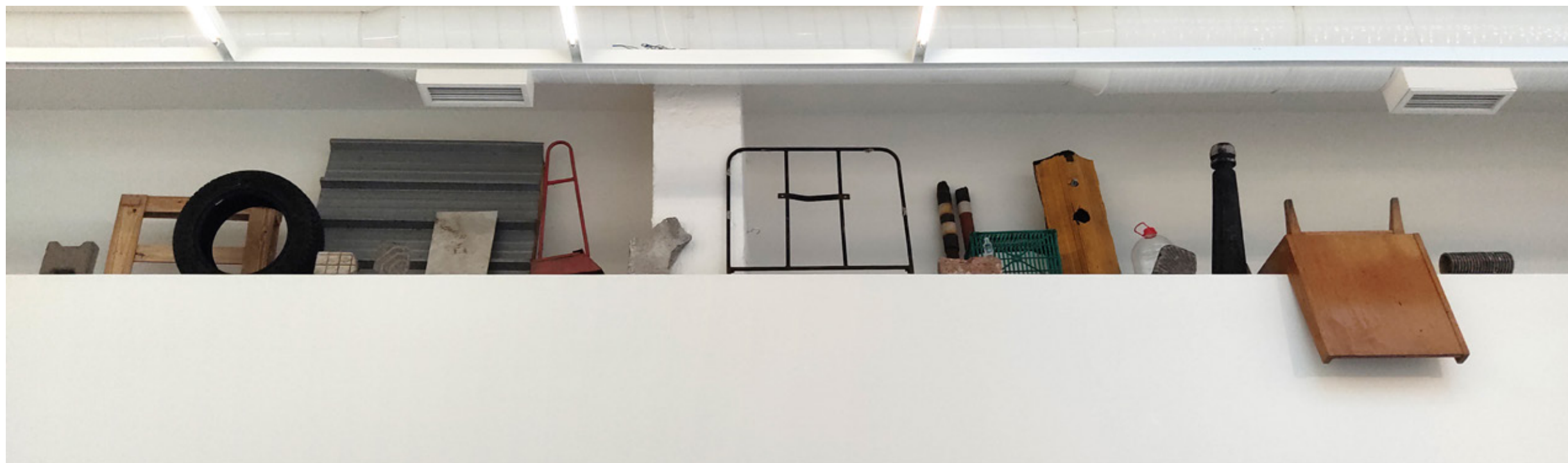
Елементарни частици (София), 2021. намерени материали, структура на галерията, вариращи размери / Elementary Particles (Sofia), 2021, found materials, gallery structure, dimensions variable

The work is an assemblage of objects found on the streets of Sofia. The objects are selected due to their specific typology, communal ways of their use and their repetitive appearance in the city center. They are recognized as markers of spatial and social relations and the specific economy of the place. Positioned on the elevated niches of the gallery – on the edges of the wall, they transform it into a new kind of stage; as a performative troupe “looking down” onto the white cube. The assemblage comments on the relation between the citizens and the urban environment, the “high and low” culture, the economy of everyday life and its relation to cultural production.