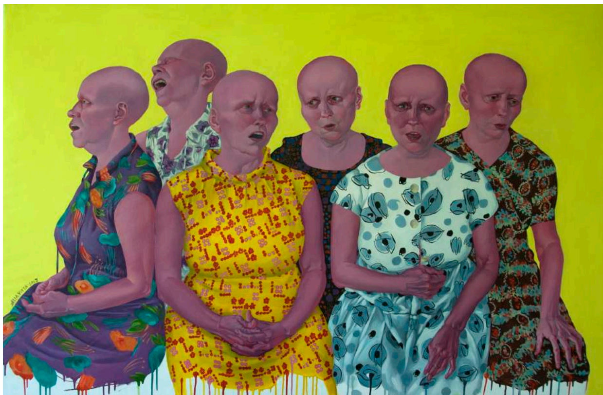
Алла Георгиева. Мамини рокли / Alla Vitta vs Jan van Eyck, 2013, маслени бои, платно, 100 x 155 см